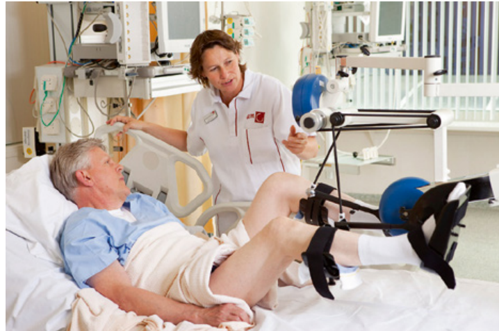
Figuur 2 Gebruik van de bedfiets bij een intensivecarepatiënt.

uithoudingsvermogen, minder spierkracht en verminderde beweeglijkheid van de gewrichten. Eén jaar na ontslag heeft circa de helft van de patiënten die meer dan twee dagen op de IC is behandeld en beademd nog lichamelijke beperkingen in het dagelijks functioneren. Ook na vijf jaar kunnen er nog lichamelijke klachten zijn ten gevolge van de IC-opname en kritieke ziekte. 3 Het meest in het oog springende beeld is IC verworven spierzwakte (ICU acquired weakness). Naar schatting heeft circa 50% van de IC-patiënten met sepsis, multi-orgaanfalen of langdurige sedatie en beademing, IC verworven spierzwakte. Deze spierzwakte ontstaat op de IC en treft zowel de ledematen als de ademhalingsspieren en leidt tot een vertraagde revalidatie na ontslag. Pathofysiologisch is er bij patiënten met IC verworven spierzwakte sprake van een complexe functionele en structurele verandering van de zenuw (axonale degeneratie) en spier (atrofie).